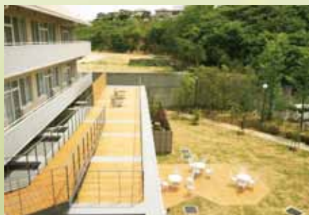
ウッドデッキ・中庭 車いすや杖歩行のご利用者様も自由に外へ出られるバリアフリーのウッドデッキです。広々とした芝生の中庭には、遊歩道もあり四季折々の花や鳥のさえずりを聴きながら、散歩を楽しんでいただけます。