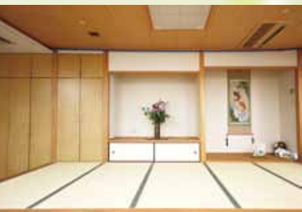
くつろぎの和室 デイルームに面してオープンに設置された和室。 冬には掘りごたつになる談話スペースです。