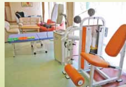
リハビリテーション 設備の整ったリハビリスペースにて個々の身体機能の維持、改善を図るため、「運動療法」「日常生活活動訓練」などの健康増進プログラムを実施しています。