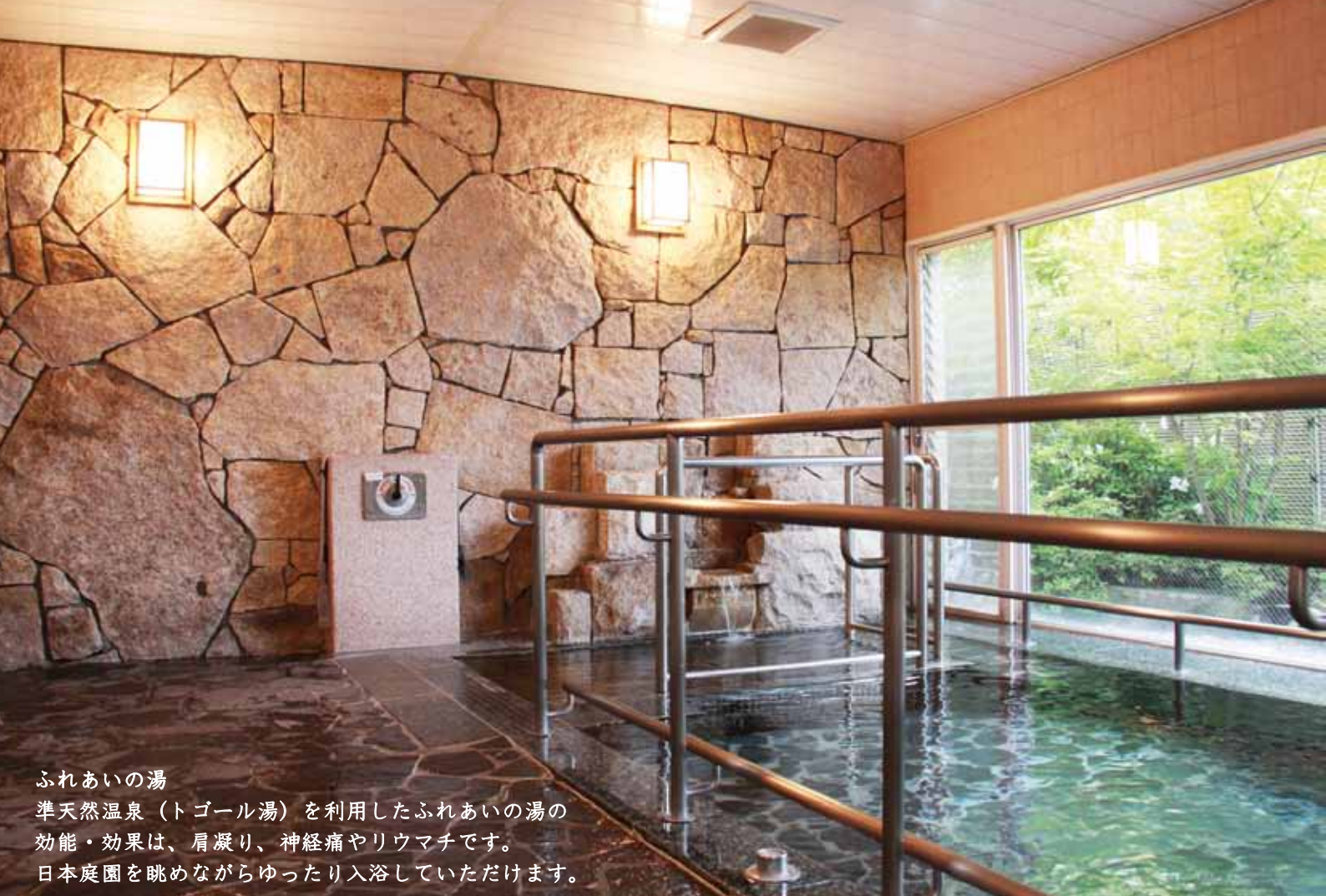
ふれあいの湯 準天然温泉（トゴール湯）を利用したふれあいの湯の 効能・効果は、肩凝り、神経痛やリウマチです。 日本庭園を眺めながらゆったり入浴していただけます。

快 適 な ひ と と き を … 友 愛 の 里 で 緑 溢 れ る 潤 い と 心 温 ま る 空 間