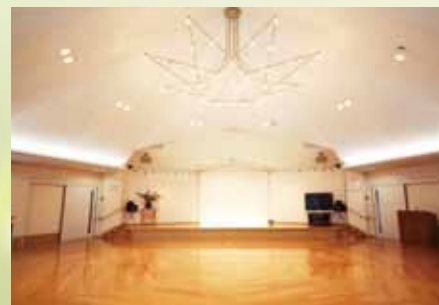
多目的ホール かわいい八角形の多目的ホールは地域交流の拠点。交流会や各種行事を通じて生きがいを育んでいきます。