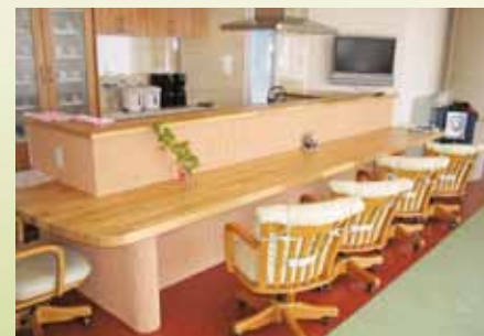
喫茶コーナー カラオケ喫茶、おやつバイキングなど憩いの場として多彩にご利用いただけます。食後のコーヒーで心安らくひとときを…